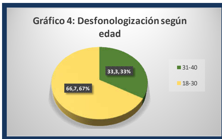
Gráfico 4. Desfonologización según edad

6.4. Análisis cuantitativo: la prueba de chi-cuadrado ( \chi^2 ). Efectos de las variables sexo , nivel de instrucción y grupo etario en la variable dependiente grado de desfonologización