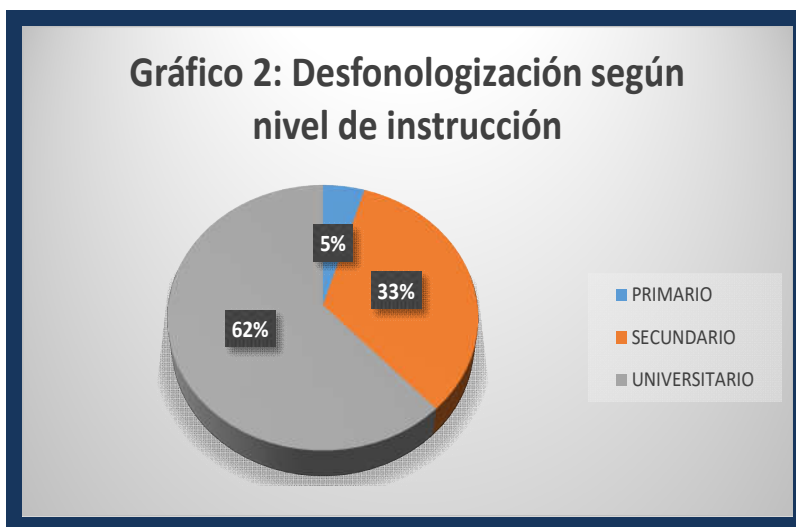
Gráfico 2. Desfonologización según nivel de instrucción